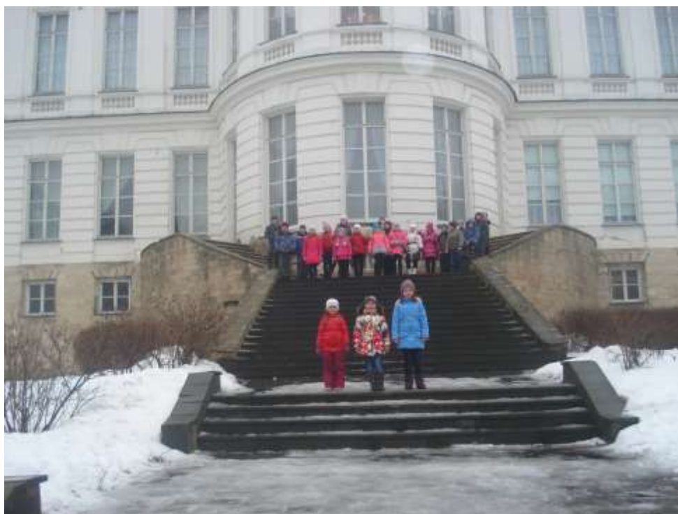
В планетарий и музей космонавтики в г. Калуга